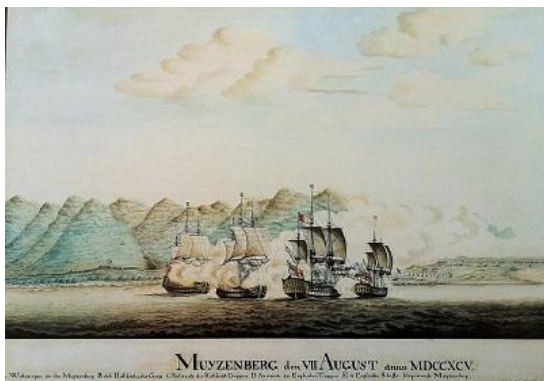
Tek.: J. Frederici. Parlemb. Bibl.

So lank as wat ek kan onthou het daar twee twaalfponders in die gras langs die rolbalbaan in Muizenberg lê en verroes. Dit is moontlik dat hulle in die verdediging van die Kaap gebruik is. As deel van die opgradering van die kusweg van Simonstad af tot by Sandvlei, het die Stadsraad die twee swaar kanonne mooi skoongemaak, op behoorlike affuite gesit en by die ingang van ’n nuwe park geplaas. Dankie, Stadsraad.