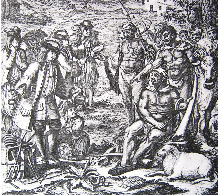
P. Kolb: Naauwkeurige ... beschrijving van de Kaap... . Amsterdam, 1731.

In September 1716 word 'n veeruil-ekspedisie onder poshouer Swartsenberg van die vervoerpos De Schuer na die Klein-Namaqua gestuur. Hy het twee korporaals, vier-en-twintig soldate en 'n wamaker vir hul drie waens. Hul ruilgoed is 500 pond tabak, drie-en-'n-half aam arak (1 aam = 144 l.), 60 000 koper- en glaskrale, pype en tonteldose. Hulle kom in November terug met 288 trekbeeste vir die vervoerdiens.