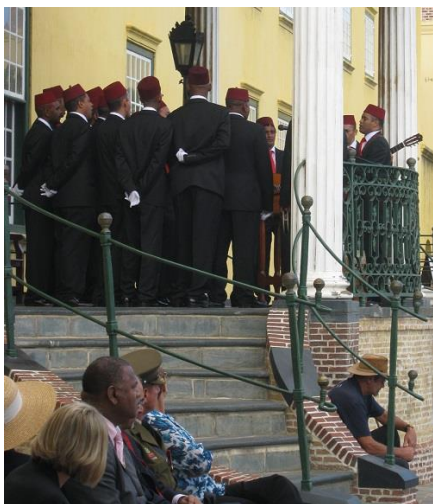
Pui in kulturele gebruik.

Ons het die HUB en sy kollegas nogmaals daarop gewys dat Kasteel de Goede Hoop geen ‘ Kat balcony ’ het nie, dat ten minste een van hulle ‘ warrior kings ’ geen hoofman was nie en reeds dood is voor daar aan die bou van die Kasteel gedink is, en ons het ook nogmaals aangebied om hulle met navorsing te help.