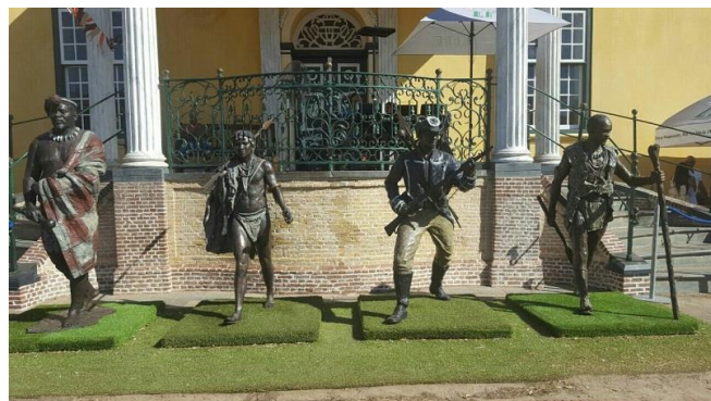
Pui as slaaf van beleid.