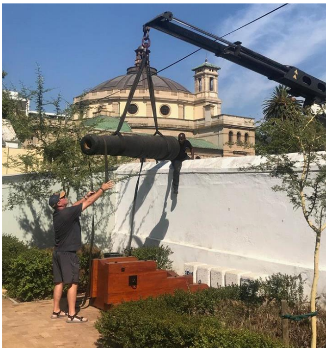
Kanon word op affuit gelê.

As 'n voorbeeld van die bewaringswerk wat die Kaapse Erfenistrust doen, plaas ons die volgende uittreksel uit hul Nuusbrief.